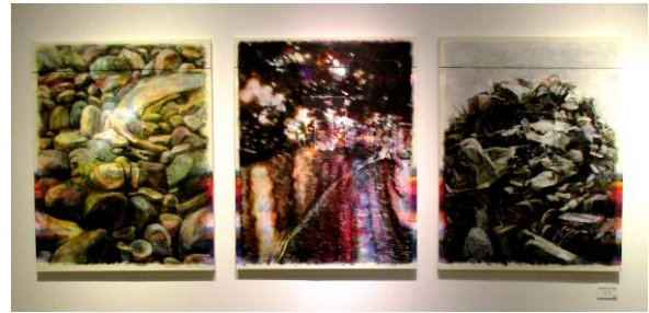
「水の行方(刻の単位)」キャンバスにコラージュ、アクリル 2018