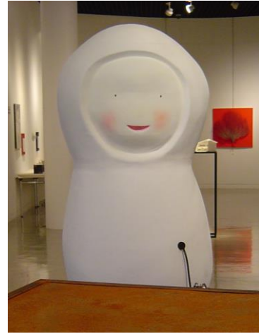
「peep」 ミクストメディア 2008