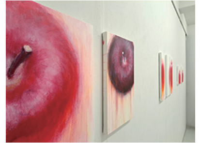
Fusion+PLUS (ギャラリー58 銀座)