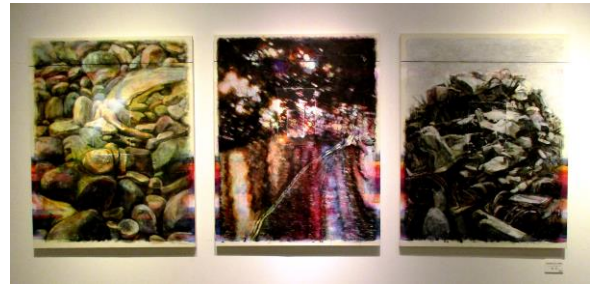
「水の行方(時の単位)」キャンバスにコラージュ、アクリル 2018